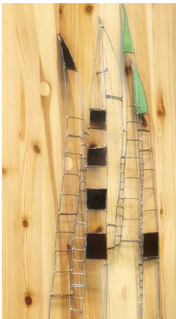
Nosrat Mansouri Vuurtoren

www.werkelijkheid.com info@werkelijkheid.com