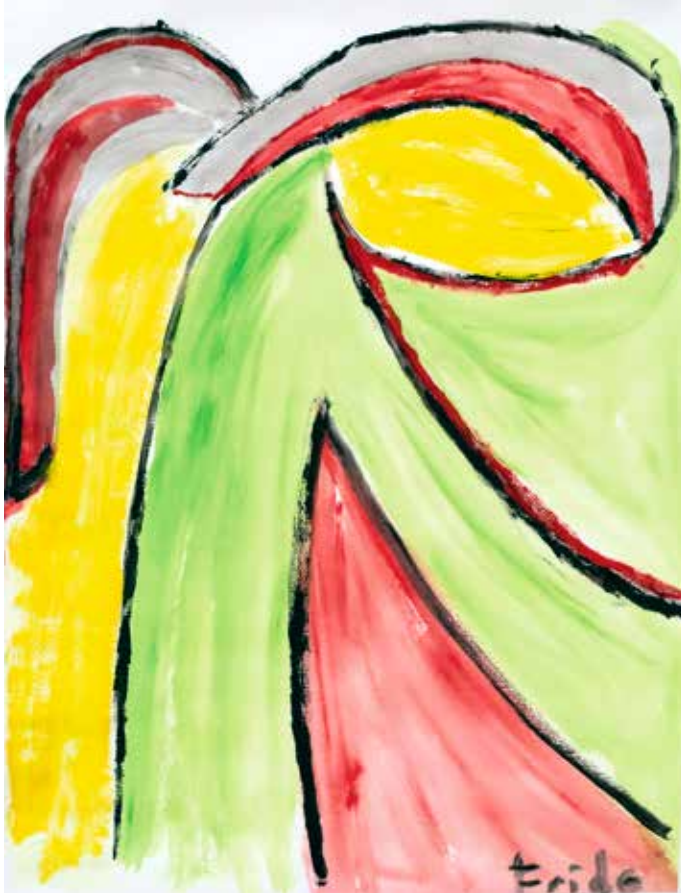
Nederige engel - Frida