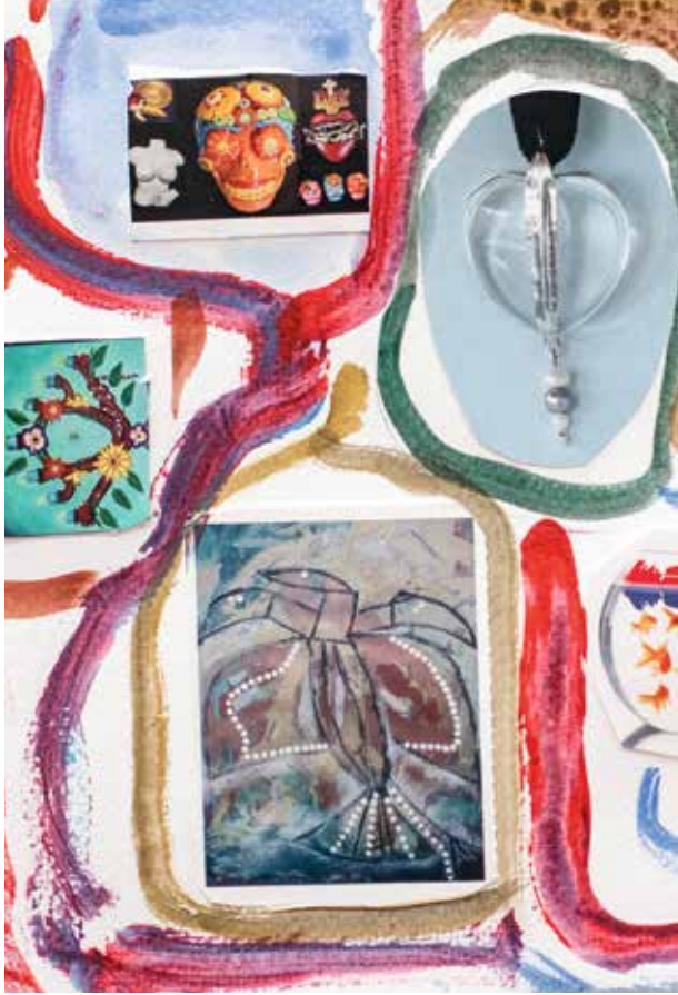
Doolhof - Hilde