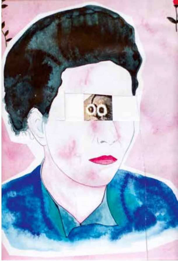
Bespottelijke spotprent - Ad