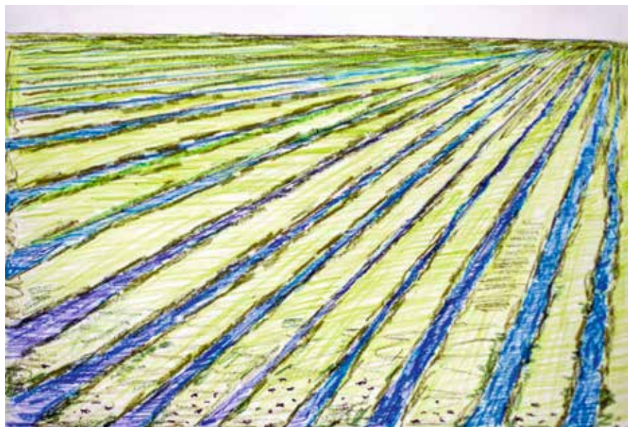
Het verschiet - Jaco